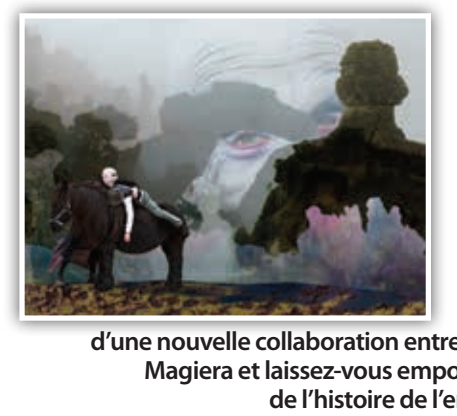
Chaque année, le Parc initie un partenariat avec une équipe artistique autour de la réalisation d'une œuvre, porteuse de sens, et révélant les caractères d'un paysage différent. Son intention est l'approche sensible de ces espaces qui permet découverte, compréhension et valorisation du grandiose comme de l'ordinaire, de la carte postale comme de l'antichambre... Découvrez le fruit d'une nouvelle collaboration entre le Parc et la photoconteuse Clémentine Magiera et laissez-vous emporter dans les rouleaux du vent à l'écoute de l'histoire de l'enfant-joli. www.parc-grands-causses.fr

Les photos des grands « voiliers du ciel » sont de la LPO Grands Causses et de Bruno Berthémy ; elles ont été dénichées par Katia Daudigeos . Depuis plus de trente ans, la LPO Grands Causses mène les programmes de réintroduction et de conservation des populations de vautours dans les Grands Causses, en collaboration avec le Parc national des Cévennes et avec le Parc naturel régional des Grands Causses. La connaissance de ces populations passe par les suivis de reproduction mais aussi par l'étude de leurs déplacements, de leurs régimes alimentaires, de l'évolution générale des colonies. rapaces.lpo.fr/grands-causses